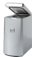
TM 1 L Milch - Peltierkühler silber