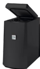
TM 1 L Milch - Peltierkühler schwarz