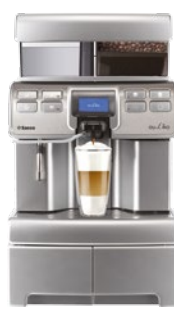
Aulika High Speed Cappuccino Festwasser